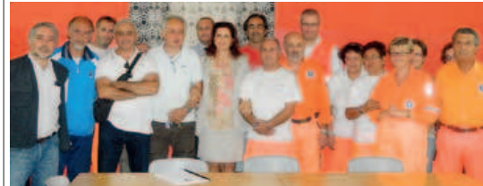
Il commissario prefetizio insieme ai volontari della PAT durante la visita di mercoledì scorso