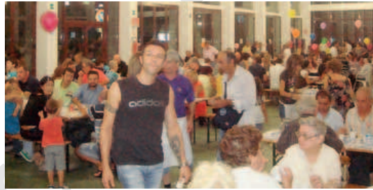
La festa del Circolo Amici Abruzzesi si terrà sabato sera all'interno del Mercato Coperto