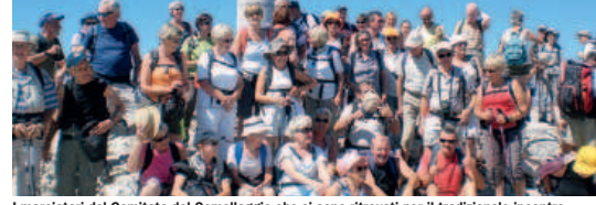
I marciatori del Comitato del Gemellaggio che si sono ritrovati per il tradizionale incontro

«mi) - Il Comitato del Gemellaggio ha celebrato ad Asiago dal 25 agosto al 1° settembre il suo venticinquesimo anno di Marcia dell'Amicizia. Erano presenti all'incontro ventinove italiani, ventidue tedeschi, ventidue francesi e tre inglesi. Le marce giornalieri, oltre a far scoprire i bellissimi panorami dell'altopiano, prevedevano il raggiungimento dei luoghi storici legati alla I Guerra Mondiale - Monte Zebio, Cima Ortigara, Cima Caldiera, Cima Portule - per la visita delle trincee e dei cimiteri di guerra. Il tempo è stato clemente